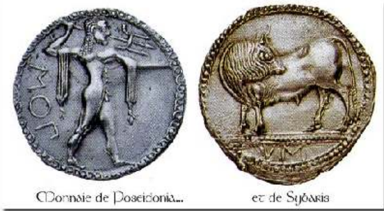
Monnaie de Poseidonia...