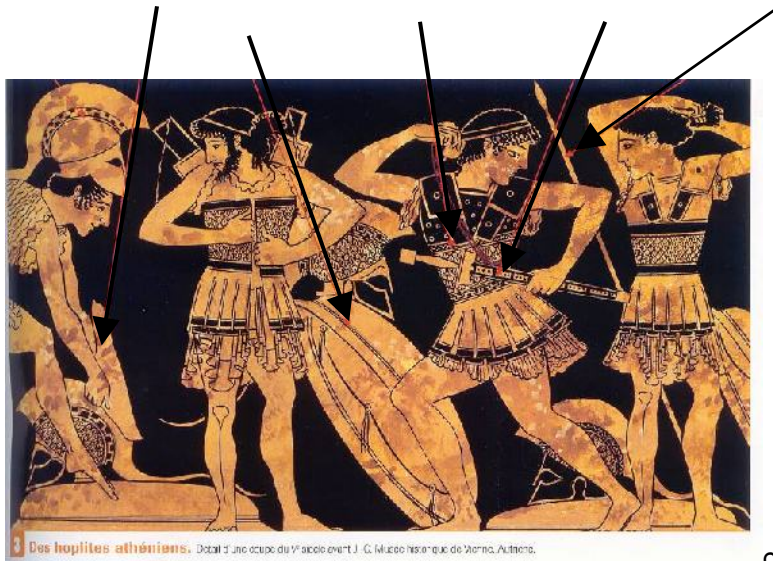
Des hoplites athéniens. Détail d'une coupe du VI e siècle avant J.-C. Musée historique de Vienne, Autriche.