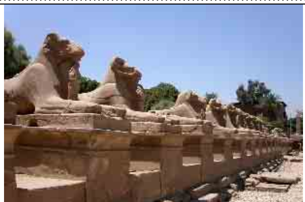
Photo de l'allée des sphinx reliant les deux temples d'Amon-Rê. Elle mesure 3 kilomètres de long.